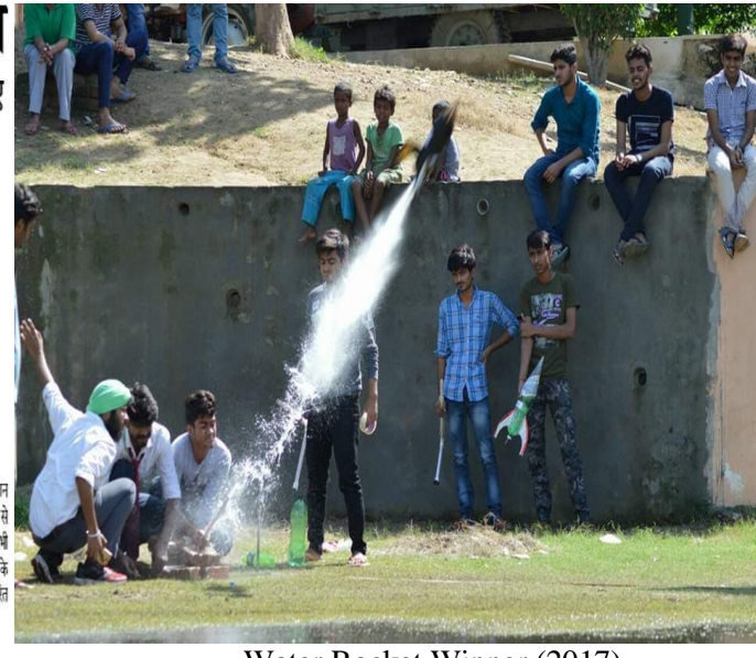
Water Rocket Winner (2017)